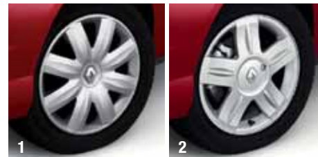
1. RADABDECKUNG 14'' „CYCLADE“